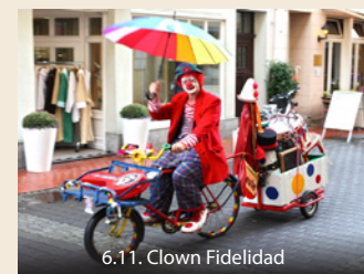
6.11. Clown Fidelidad