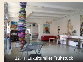
22.11. Lukulturelles Frühstück