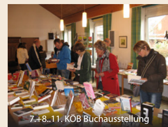
7.+8..11. KÖB Buchausstellung